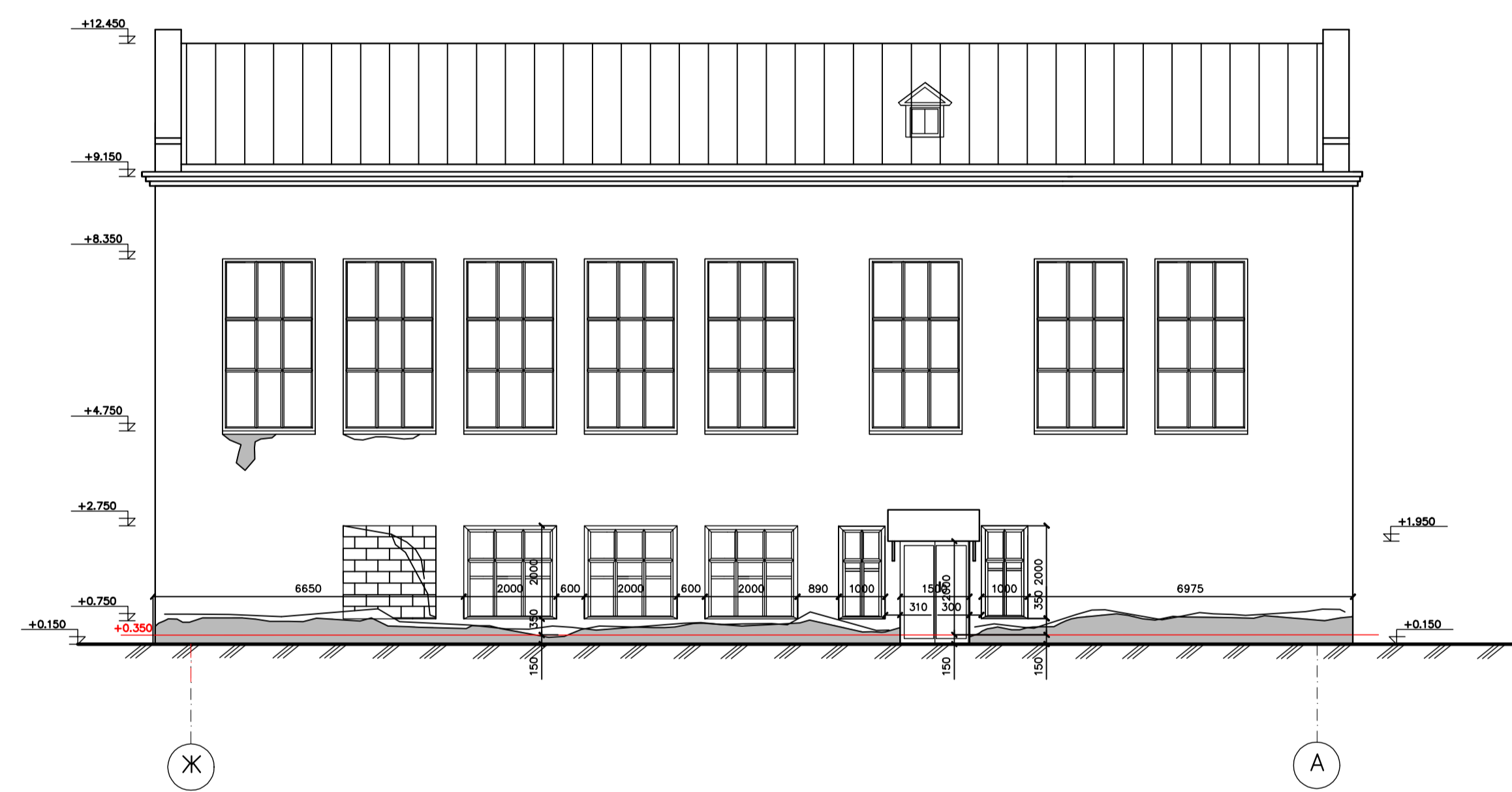
Фасад Ж-А (северо-западный фасад)